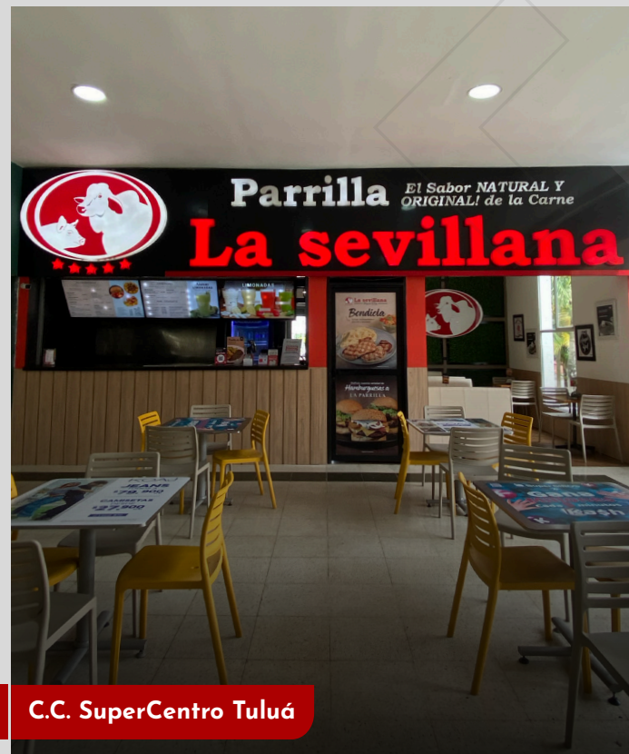
C.C. SuperCentro Tuluá

La principal razón para emprender bajo el modelo de franquicias en La Sevillana Parrilla es que no se necesita empezar de cero, somos una marca con una importante trayectoria en el mercado regional que nos permite brindar la asesoría, acompañamiento y las herramientas necesarias para garantizar un modelo de negocio interesante.